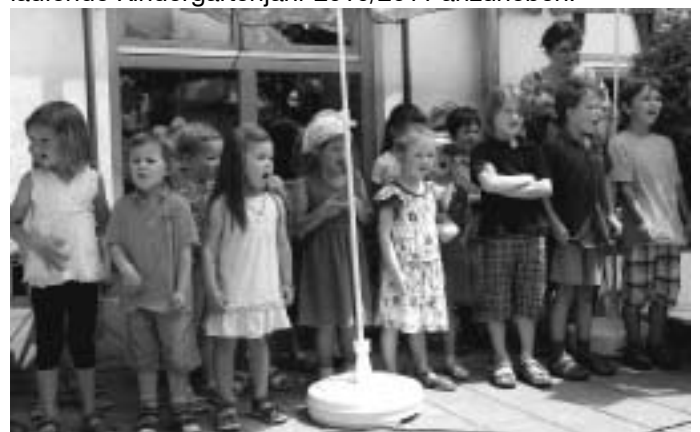
Kindergartenfest Sindlbach 2011

In diesem Zuge wird darauf hingewiesen, dass in der Sitzung am 11.11.2010 der Beschluss gefasst worden ist, die Förderung von 55,00 Euro/Monat auf 68,00 Euro/Monat für das laufende Kindergartenjahr 2010/2011 anzuheben.