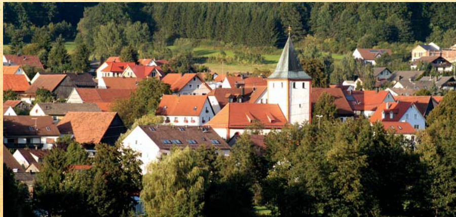
Von Südwesten hat man einen reizvollen Blick auf den Ort.