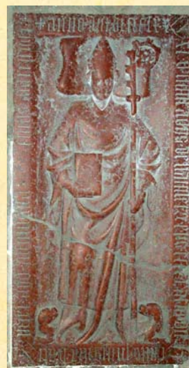
Oben: Das Grabmal des Bischofs Konrad VI. von Haimburg im Regensburger Dom. Unten: Das Grabmal liegt als Bodenplatte direkt neben dem rechten Westeingang des Doms.

Von 1347 an war er Domkanoniker und von 1363 - 1368 Domprobst. 1368 wurde er zum Bischof von Regensburg gewählt. Wie opferbereit Bischof Konrad VI. war, kann verschiedenen Aufzeichnungen entnommen werden. So soll er seinen geerbten Anteil am Schlossgut Haimburg 1773 an den bayerischen Herzog Otto V. verpfändet haben, um Schulden des Bistums zu decken. Auch um den Bau des Regensburger Domes hat sich Konrad VI. überaus verdient gemacht.