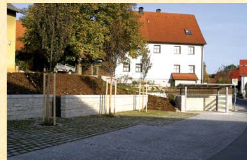
Im Jahr 2003 wurde der Vorplatz aufwändig zum Umsteigeparkplatz umgestaltet.

Der Ort Sindlbach der Gemeinde Berg mit seinen rund 630 Einwohnern liegt zwischen dem Lindenbühl und der geschichtsträchtigen Haimburg. Der Ort dürfte bereits vor dem Jahr 1000 entstanden sein. Erstmals urkundlich erwähnt wird der Ort 1129, als in Urkunden des Klosters Kastl der Sindlbacher Pfarrer Chunradus de Soundelbach, der erste bekannte Pfarrer Sindlbachs, aufgeführt ist.