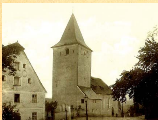
Anblick der Kirche um das Jahr 1916.

Jakobuskirchen werden häufig an alten Straßenzügen angetroffen. An einem wichtigen Verkehrsweg lag Sindlbach schon im Mittelalter, nämlich an der alten karolingischen Handelsstraße, die von Franken über den fränkischen Königshof