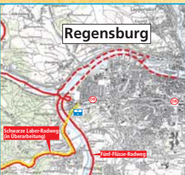
Fortsetzung Schwarze Laber-Radweg nach Regensburg

Um die Menschen für die Natur „vor ihrer Haustür“ zu interessieren, zu begeistern und zu sensibilisieren, wurden vom Landschaftspflegeverband Neumarkt verschiedene Wege in die Natur erarbeitet, welche die Naturthemen erklären und Naturgenuss pur bieten.