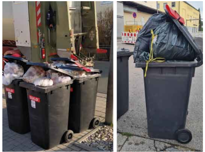
Hierfür gibt es die rote Karte.

www.landkreis-neumarkt.de/abfallwirtschaft