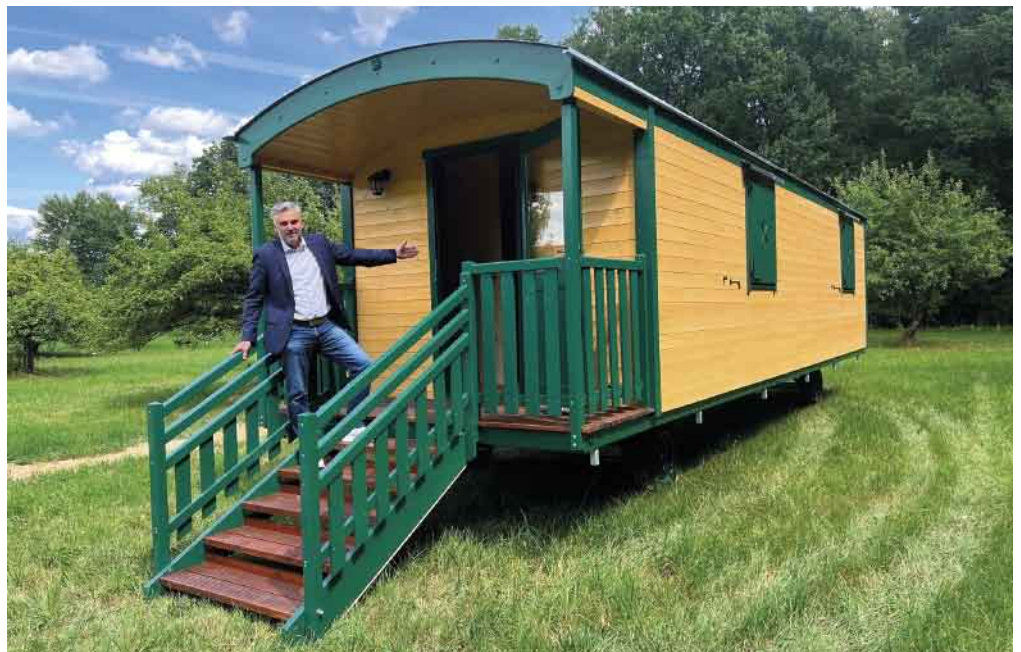
Näheres auf Seite 4/6