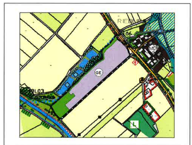
Flächennutzungsplanänderung (schwarz gestrichelte Linie - Grenze Änderungsbereich)